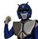
匝瑳市の環境を守るソーサラー